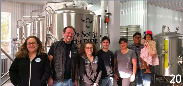
Pohénégamook 20 | Témiscaming 21