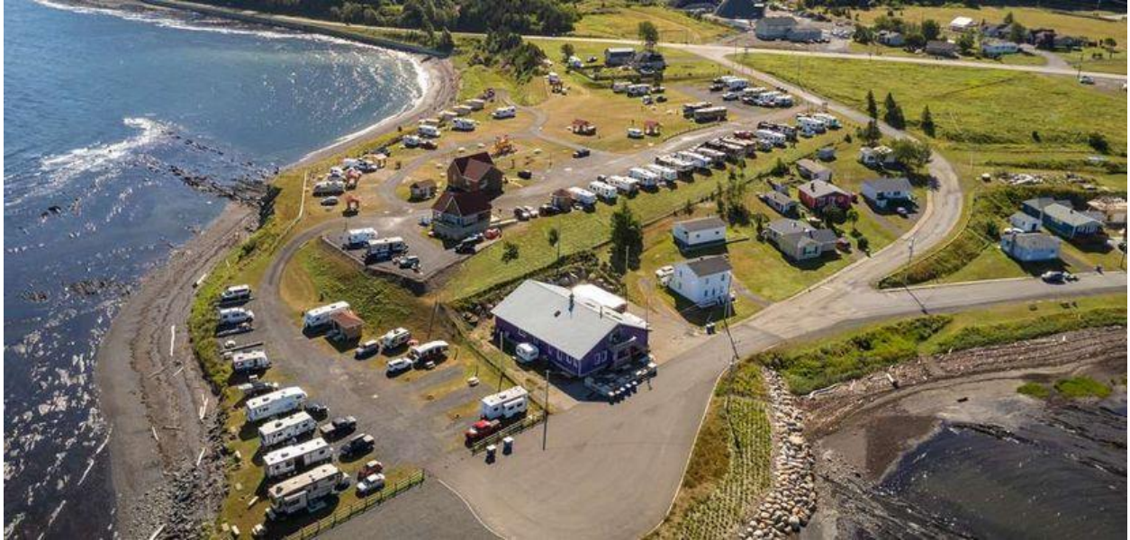
Pavillon de service de Parc et Mer Mont-Louis, Saint-Maxime-du-Mont-Louis (récipiendaire du prix Coup de chapeau du Ministère des Transports et de la Mobilité durable)

Mont-Joli a raflé le Prix Jacques-Hémond avec le développement du Mitis Lab, un espace de travail collaboratif et un centre de formation aux entreprises installé à même les locaux de la maison de la culture Château Landry, bâtiment patrimonial de la ville de Mont-Joli.