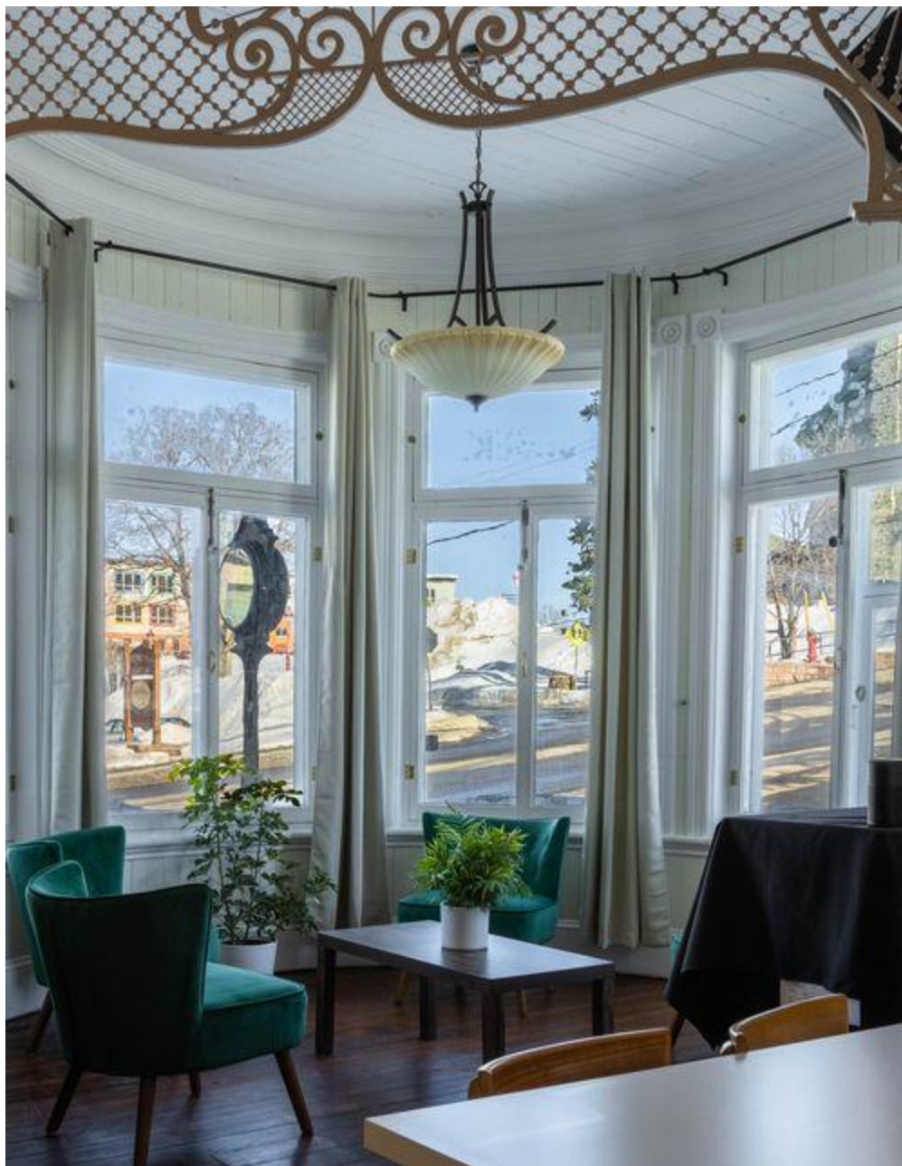
Mitis Lab, Mont-Joli (récipiendaire du prix Jacques-Hémond)

Le prix Coup de cœur du jury a été remis à Saint-Fulgence pour ses travaux de rajeunissement des monuments et bâtiments historiques de son cimetière en plus d'établir un parc spirituel pour inciter la population locale et régionale à profiter des lieux.