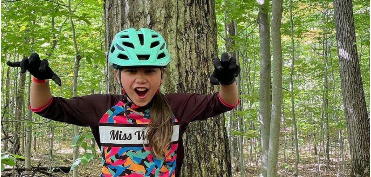
Festival du vélo de montagne, Montebello (finaliste dans la catégorie Municipalité/Organisme)

C'est par la création de la certification d'entreprise Parc naturel habité que s'est illustré le village-relais de Saint-Donat, lui permettant d'être nommé grand lauréat de la catégorie Municipalité/organisme. L'Anse-Saint-Jean et son projet de halte gourmande musicale ainsi que Montebello avec son Festival du vélo de montagne, sont tous deux finalistes dans cette catégorie.