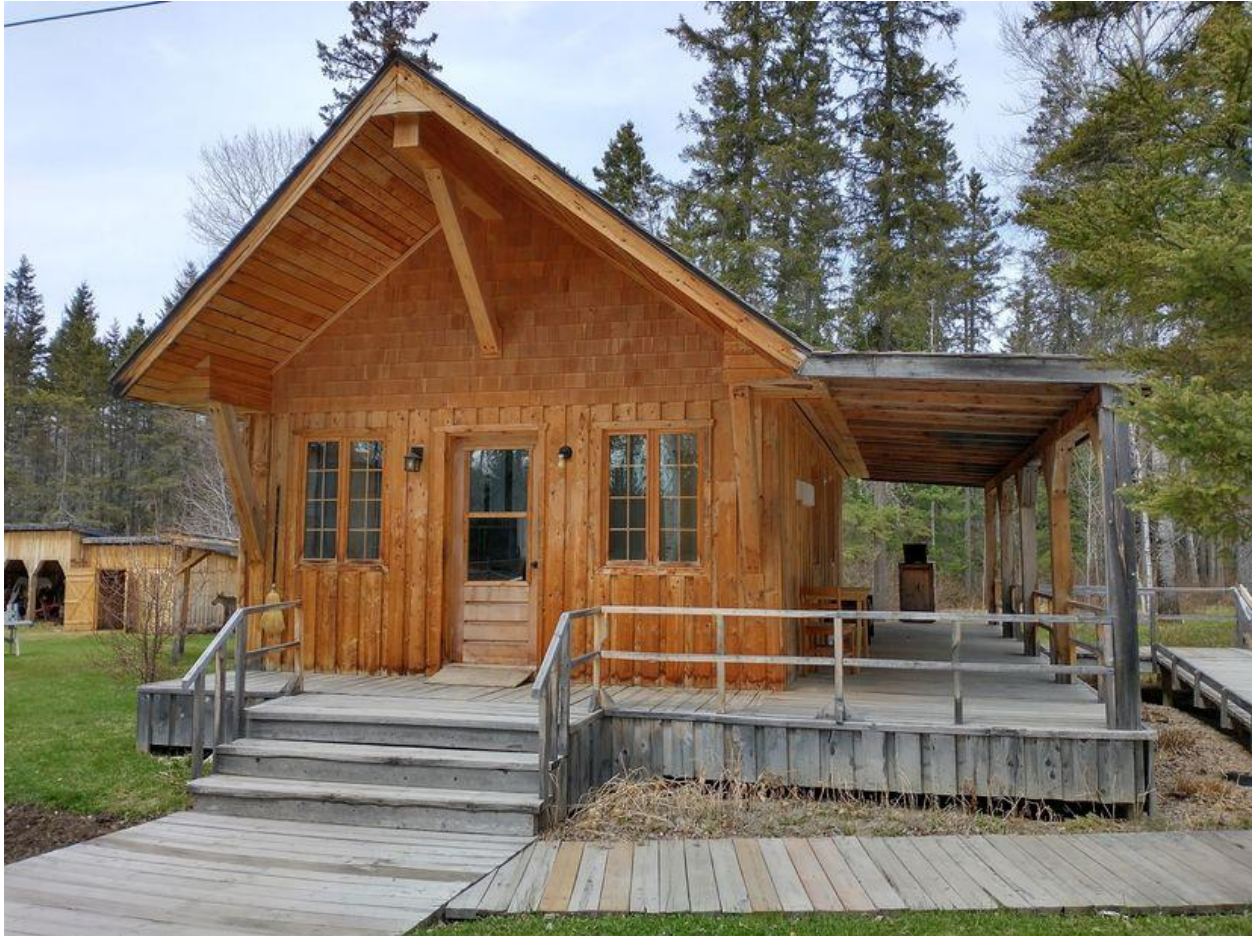
Moulin des pionniers, La Doré (récipiendaire dans la catégorie Commerce et ambassadeur)

Le Coup de chapeau du ministère des Transports et de la Mobilité durable a été décerné à l'organisme Parc et Mer Mont-Louis du village-relais de Saint-Maxime-du-Mont-Louis pour l'ouverture annuelle de son pavillon de service, permettant ainsi de fournir de nombreux services aux usagers de la route et aux citoyens défavorisés de la communauté.