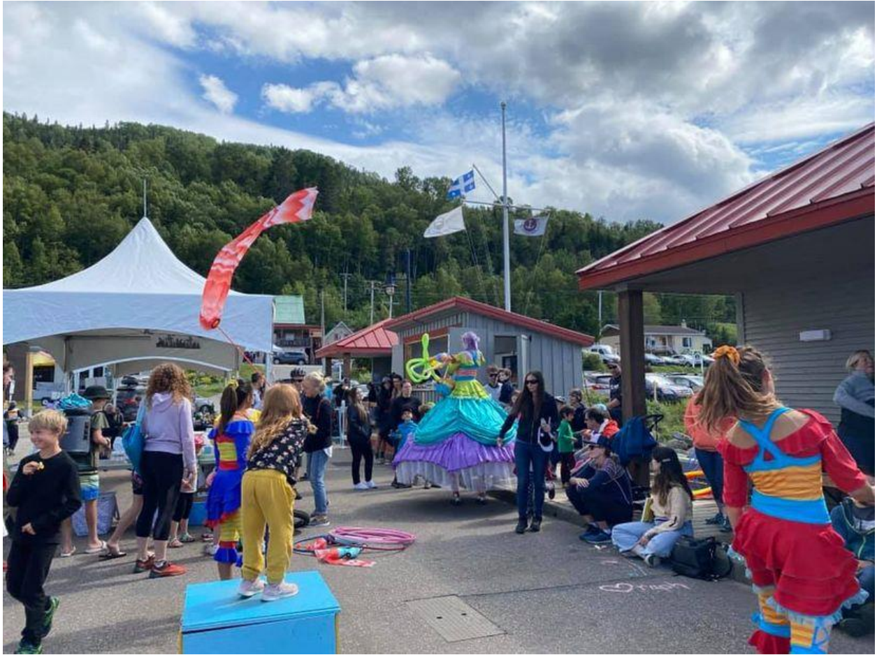
Halte gourmande musicale, L'Anse-Saint-Jean (finaliste dans la catégorie Municipalité/Organisme)

La Doré a remporté les honneurs dans la catégorie Commerce et ambassadeur par le renouvellement de l'offre touristique du Moulin des pionniers.