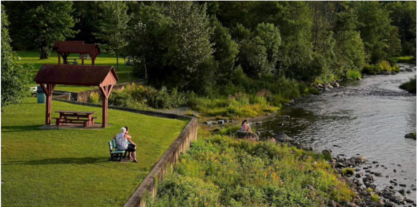
Parc du Vieux Moulin- Weedon