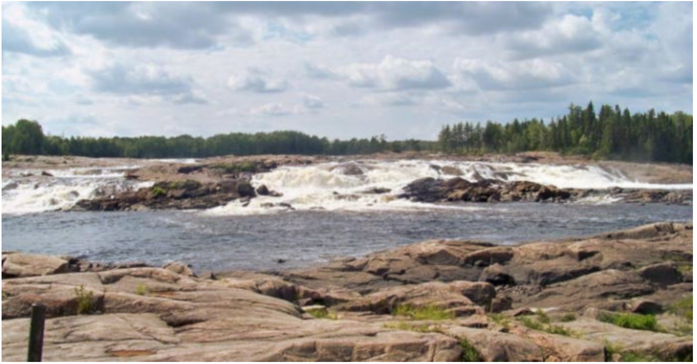
Belvédère La Petite Chute à l'Ours- La Dorée