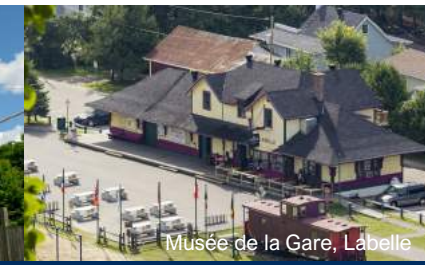
Musée de la Gare, Labelle