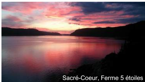
Sacré-Coeur, Ferme 5 étoiles

Visite industrielle guidée par la Ferme 5 étoiles ferme5etoiles.com 1 877 236-4551