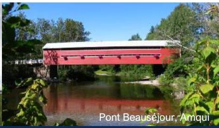
Pont Beauséjour, Amqui