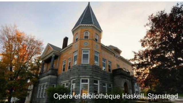
Opéra et Bibliothèque Haskell, Stanstead