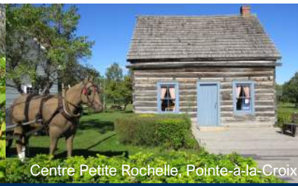
Centre Petite Rochelle, Pointe-à-la-Croix