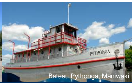
Bateau Pythonga, Maniwaki