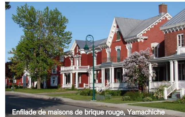
Enfilade de maisons de brique rouge, Yamachiche

Circuit historique piétonnier..... 819 424-2383 Vestige de la seconde Guerre Mondiale: Liberator Harry..... 819 424-2383