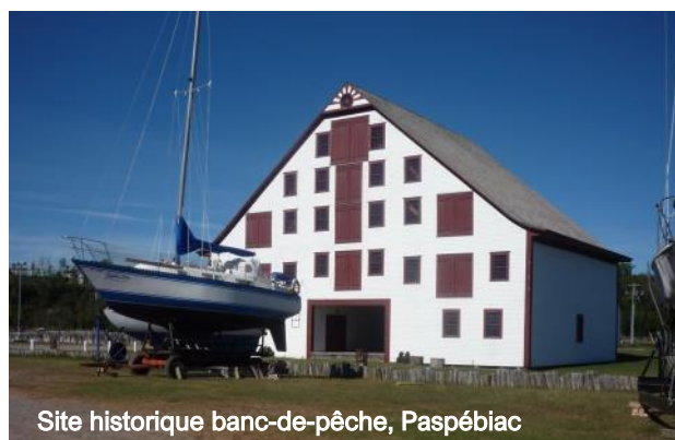
Site historique banc-de-pêche, Paspébiac

Café culture Paspébiac. .Fermé temporairement ..... 418 752-2277 Site historique banc-de-pêche... 418 752-6229