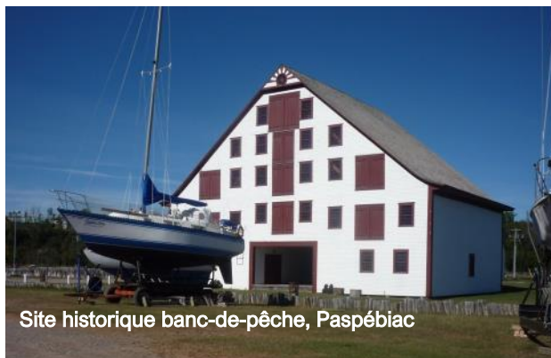
Site historique banc-de-pêche, Paspébiac

Site historique banc-de-pêche 418 752-6229