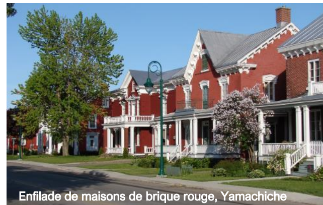
Enfilade de maisons de brique rouge, Yamachiche

Circuit historique piétonnier 819 424-2383 Vestige de la seconde Guerre Mondiale: Liberator Harry 819 424-2383