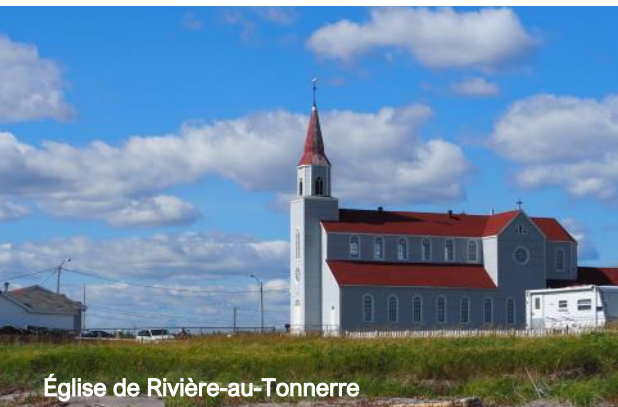
Église de Rivière-au-Tonnerre